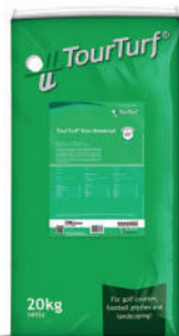
ECO UNIVERSAL 16.4.8

Fertilizzante organominerale ideale per campi sportivi, parchi e fairway. Arricchito con biostimolanti naturali a base di amminoacidi, potenzia lo sviluppo radicale e la resilienza del tappeto erboso.